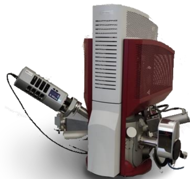
Рис. 2. Сканирующий электронный микроскоп Tescan MIRA 3 (Чехия)